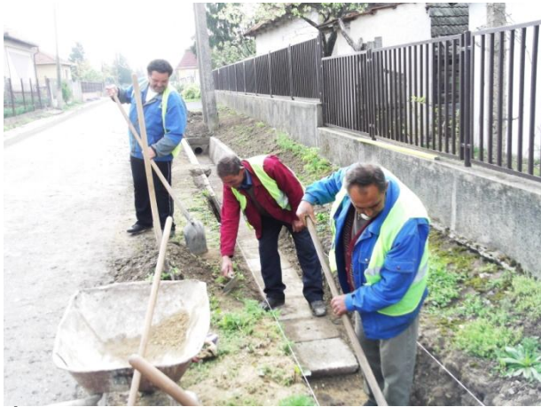
Árokburkolás a belvíz projekt keretében