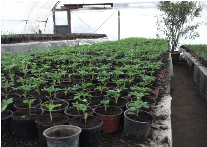
Virágpalánta nevelés 1.