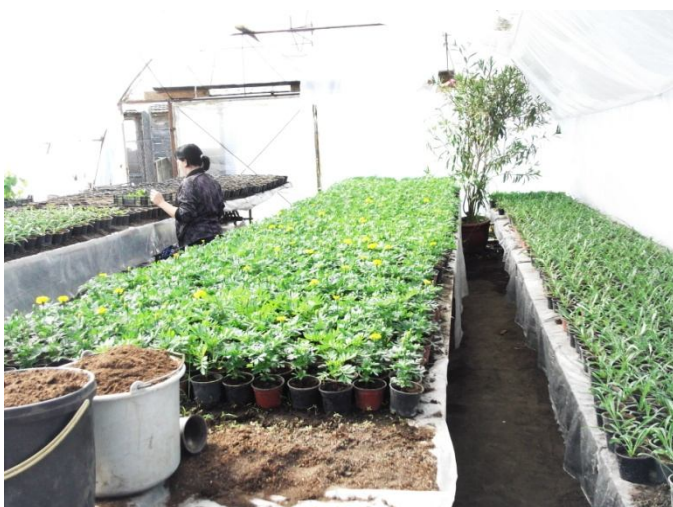
Virágpalánta nevelés 2.