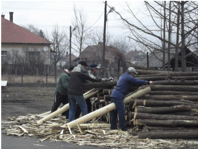
Faoszlopok háncsának leszedése