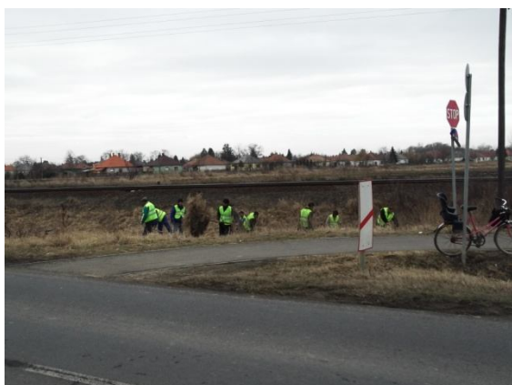
Kerékpárút melletti terület takarítása