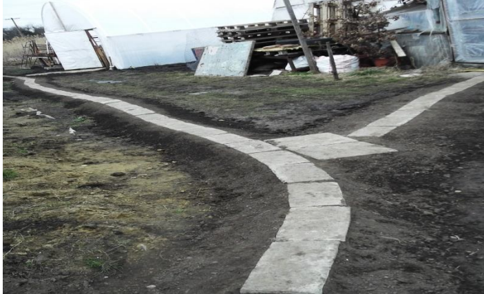
Járda kialakítása a fóliasátrak között

Ez a projektelem csupán két hónapos támogatottsági időszakot tett lehetővé, és 9 fő foglalkoztatását biztosította, de rendkívül nagy jelentősége volt a mezőgazdasági projekt előkészítési munkálataiban, valamint a tavaszi-nyári virágpalánták nevelésében.