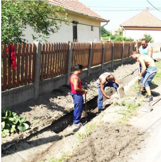
Árokfelújítás a Kisfaludy úton