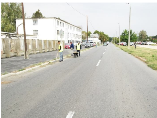
Útpadka takarítás, rendbetétel