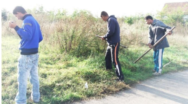
Kaszálás kézi kaszával a közút projekt keretében