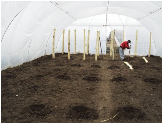
Támrendszer kialakítása a fóliában