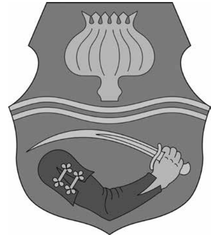
Tiszavasvári Város címere eredeti formájában