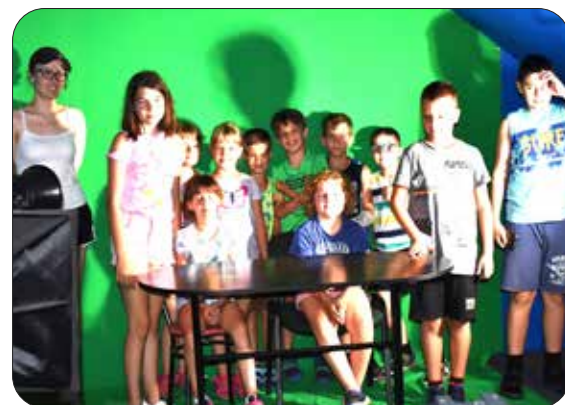
A Találkozások Háza szervezte tábor egyik programjaként a résztvevő gyerekek a Tiszavasvári Városi Televízió stúdiójában ismerkedtek a riportkészítés fortélyaival.